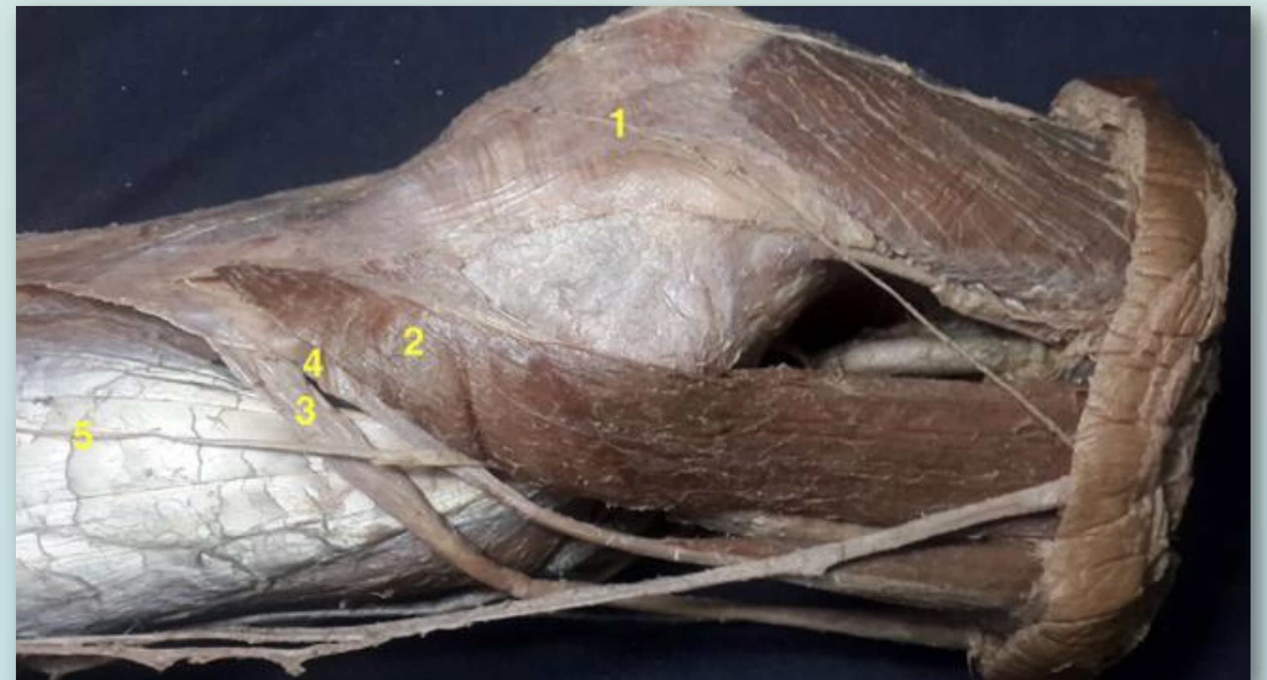
Relaciones anatómicas entre los isquiotibiales y el Nervio Safeno Interno. (1) Rama infrapatelar; (2) Musculo Sartorio; (3) Semitendinoso; (4) Recto Interno; (5) Rama terminal sensitiva.

Se evidencia una sección de la rama del nervio safeno interno y un neuroma de la rama infrapatelar accesoria del nervio safeno interno.