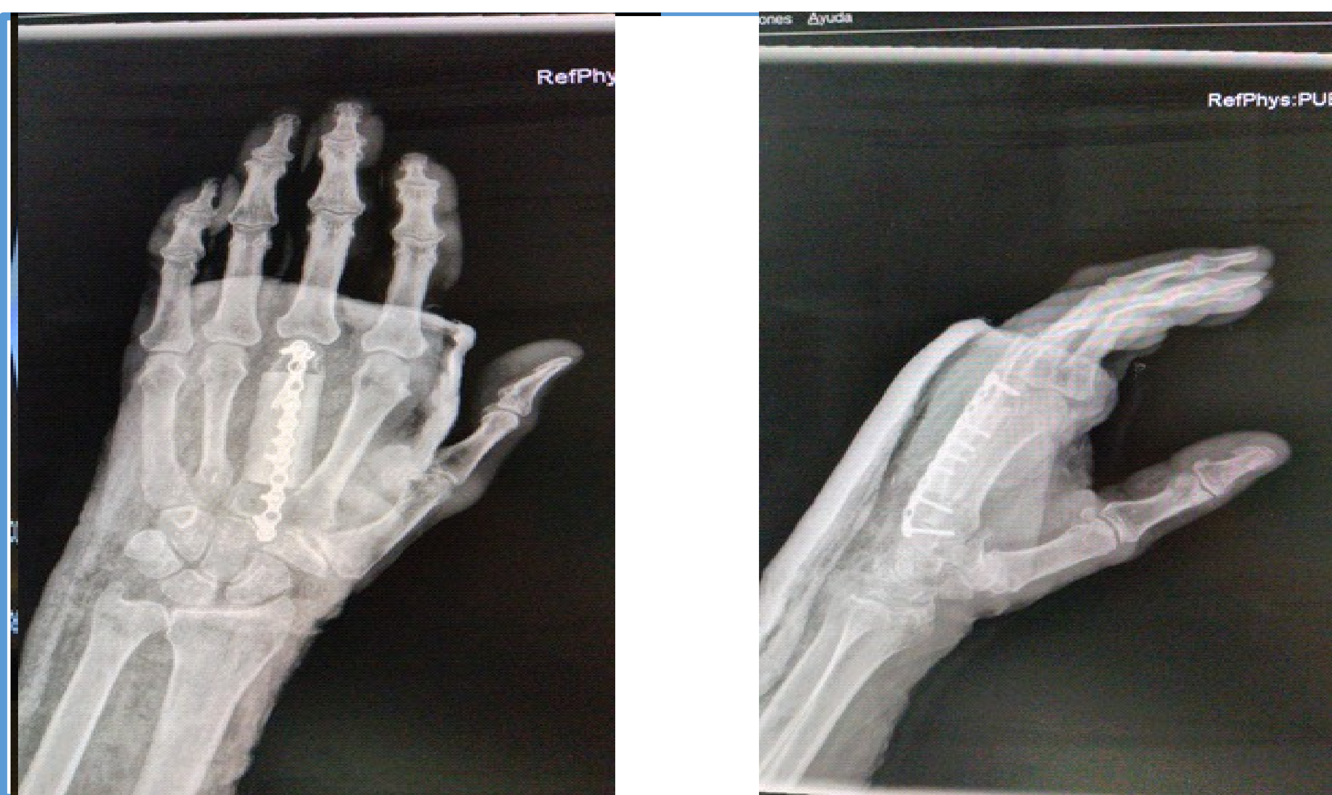
Fig 2. Radiografía posoperatoria