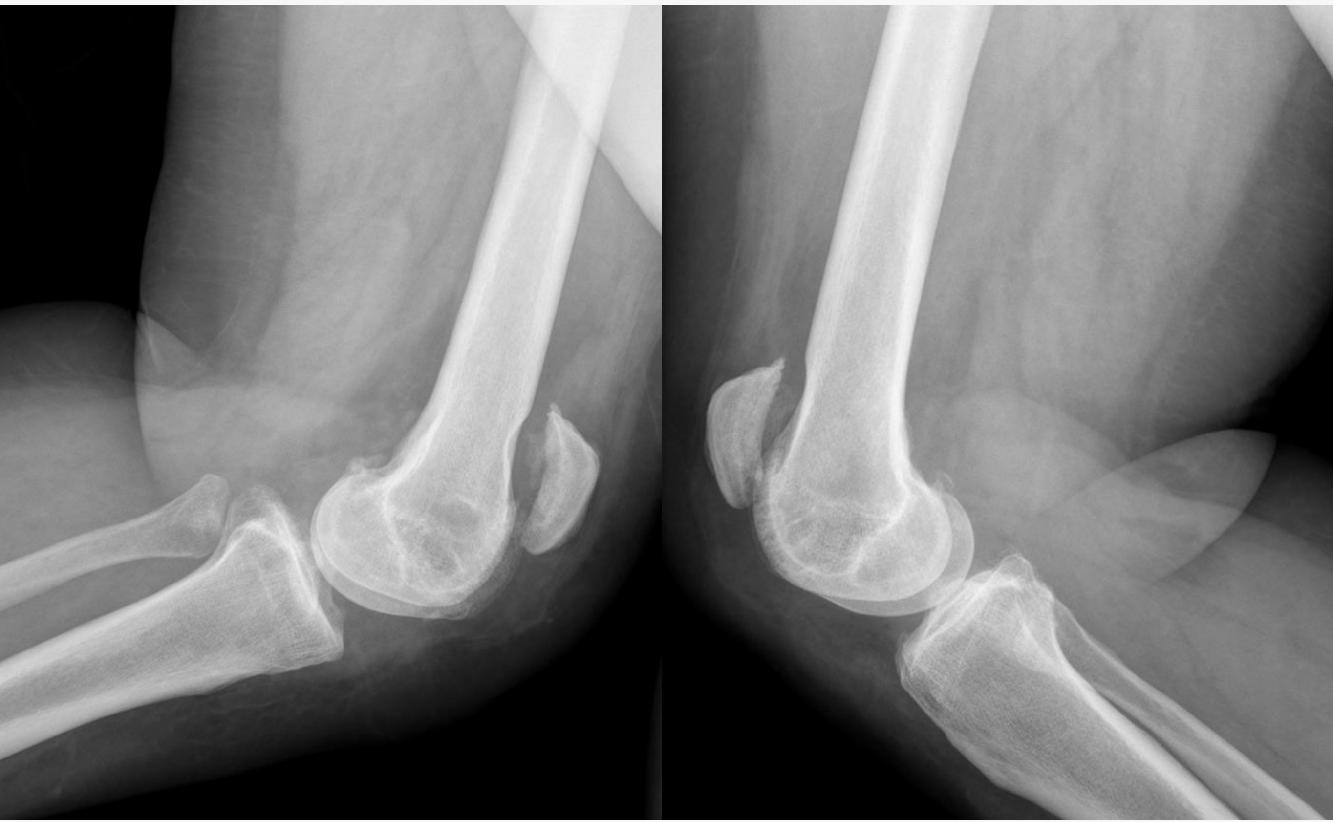
Radiografía: rotula alta bilateral, sin fracturas asociadas. Ecografía : Rotura bilateral de ambos tendones rotulianos

♀62 años, hipotiroidea, obesa mórbida, presenta gonalgia bilateral e imposibilidad para la deambulaci3n tras caída de rodillas. Exploraci3n: no lesiones cutáneas, hematoma, ni dolor a la palpaci3n de rebordes 3seos ni interlinea articular. Cajones, bostezos, y test de Lachman -- bilaterales, flexi3n conservada, déficit de extensi3n activa bilateral y exploraci3n nvd conservada. Difícil apreciar hachazo.